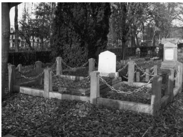
Beschermd door de prunus, ligt het door palen en bijzondere kettingen omgeven graf van de familie Kalkman