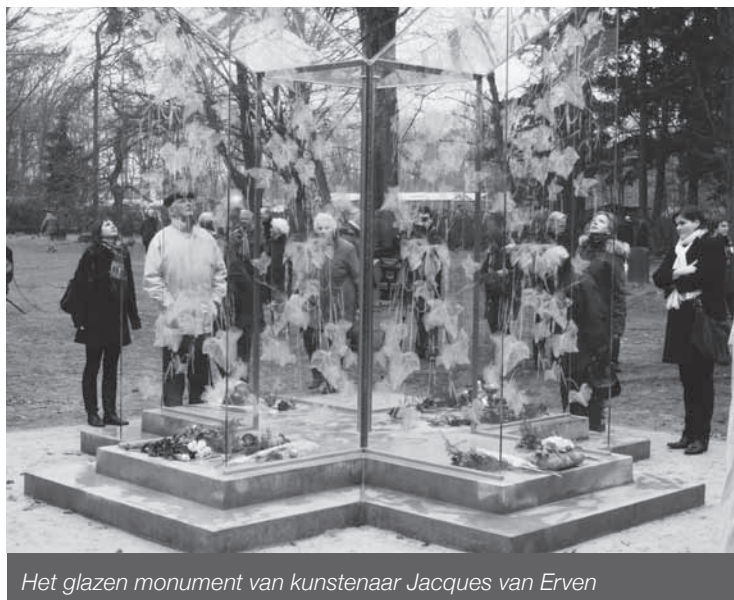
Het glazen monument van kunstenaar Jacques van Erven

Met de onthulling van een monument op de begraafplaats en het aanbieden van het boek De Namen der Naamlozen krijgen de 1800 naamloze doden op de begraafplaats van het huidige psychiatrisch ziekenhuis GGzE/Grote Beek in Eindhoven weer een naam.