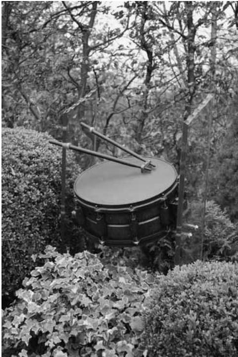
Een voorbeeld van een uniek en creatief monument op een kindergraf

maar was wel vrijer dan (in) het parkgedeelte. Er werd voor afwisseling gezorgd door van te voren te bepalen of er een stèle of een liggende steen op het nieuwe graf kwam. Nabestaanden werden zich vaak achteraf bewust van die bepaling, waardoor er nogal eens onvrede ontstond. In de beginjaren zag de naburige begraafplaats een opmerkelijk sterke stijging in het aantal nieuw uitgegeven graven. Inmiddels wordt een graf in het bosgedeelte waarvan afstand is gedaan, vaak binnen een maand alweer uitgegeven.