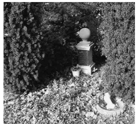
Het graf van Martinus Nijhoff wordt misschien gerestaureerd