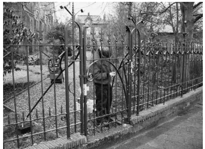
Het smeedijzeren hek rond de Kalverkerk in Zaandam wordt fris geverfd

Begraafplaatsen hebben grote historische, culturele en landschappelijke waarde. De vorm en ligging van begraafplaatsen maakt ze herkenbaar. Beplanting is hierbij beeld- en sfeerbepalend. Soms is er nog een oud beplantingsplan aanwezig en zijn er in de huidige situatie nog oude structuren en plantensoorten te herkennen. Ook zijn er planten die van oudsher geplant worden op begraafplaatsen, zoals de taxus. In de christelijke cultuur is de taxus het symbool voor dood en rouw. Tevens is hij, vanwege zijn altijd groene naalden, zinnebeeld van onsterfelijkheid en eeuwigheid. In sommige streken wordt de taxus ook wel doodsbom genoemd. Omdat er in het verleden altijd gebruik werd gemaakt van inheemse soorten, is beplanting vaak karakteristiek voor een bepaalde regio. De natuurwaarde van inheemse soorten is hoog omdat er veel andere organismen aan gebonden zijn zoals vogels,