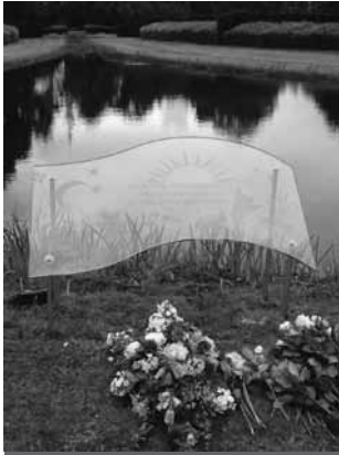
Glazen monument op begraafplaats Kranenburg in Zwolle voor anoniem begraven kinderen. In het glas zijn symbolen van kindermunten gegraveerd, zoals beertjes en manen