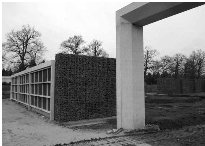
Galerijgraven in aanbouw. De vorm en uniformiteit doet denken aan een columbarium