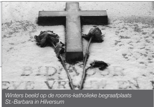
Winters beeld op de rooms-katholieke begraafplaats St.-Barbara in Hilversum

'Ik ben bij toeval begraafplaatsen gaan fotograferen. Op een dag ben ik, toen ik met mijn fototoestel op pad was en voor de zoveelste keer langs deze begraafplaats fietste, afgestapt en naar binnengegaan. Ik heb uren rondgelopen en gefotografeerd. Ik probeer altijd een ander, minder voor de hand liggend beeld vast te leggen, zoals een doorkijkje, een lichtstraal dat op een beeld valt of een klein detail. Mijn aandacht gaat niet zozeer uit naar de architectuur, de symboliek of stijlen, maar veel meer naar het onverwachte. Met de plattegrond in de hand ben