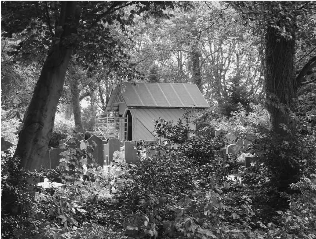
Het gerestaureerde baarhuisje op het kerkhof van de Grote Kerk in Monnickendam

schimmels en insecten. Vanuit deze invalshoek is het van belang begraafplaatsen goed te onderhouden en gebruik te maken van inheemse soorten.