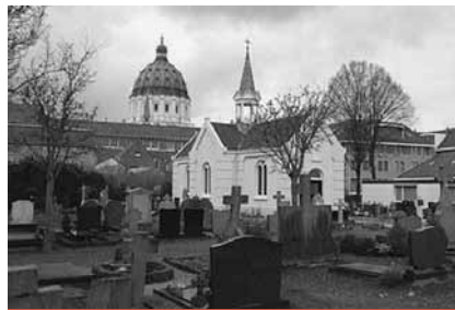
Kapel rooms-katholieke Begraafplaats Oudenbosch

In de digitale nieuwsbrief stond in 2008 de serie Belang van Samenhang. Alle delen zijn nu terug te lezen op de website. Belangstellenden kunnen de serie ook in papieren editie bestellen ( terebinth@planet.nl ). De kosten bedragen € 2,50 (incl. verzendkosten).